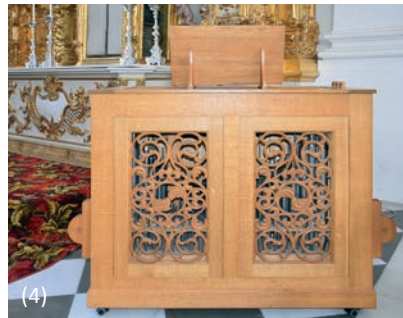
(4) Führer-Truhenorgel (erbaut 2011)